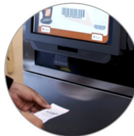
Sistema de Monitoreo Remoto.