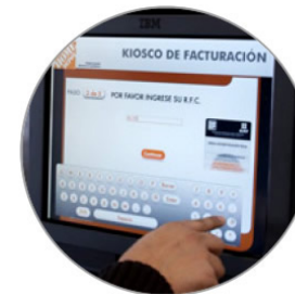
Interfase con Pantalla Touchscreen.