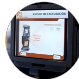
Aplicación de Auto-servicio.