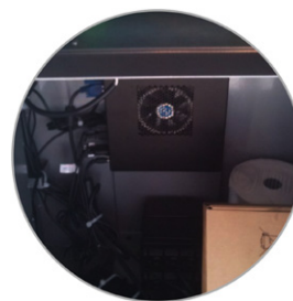
CPU de grado industrial.