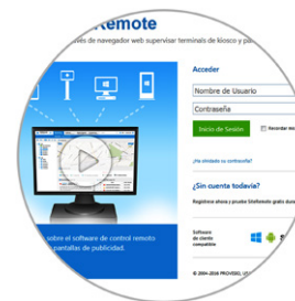
Aplicación de monitoreo remoto.